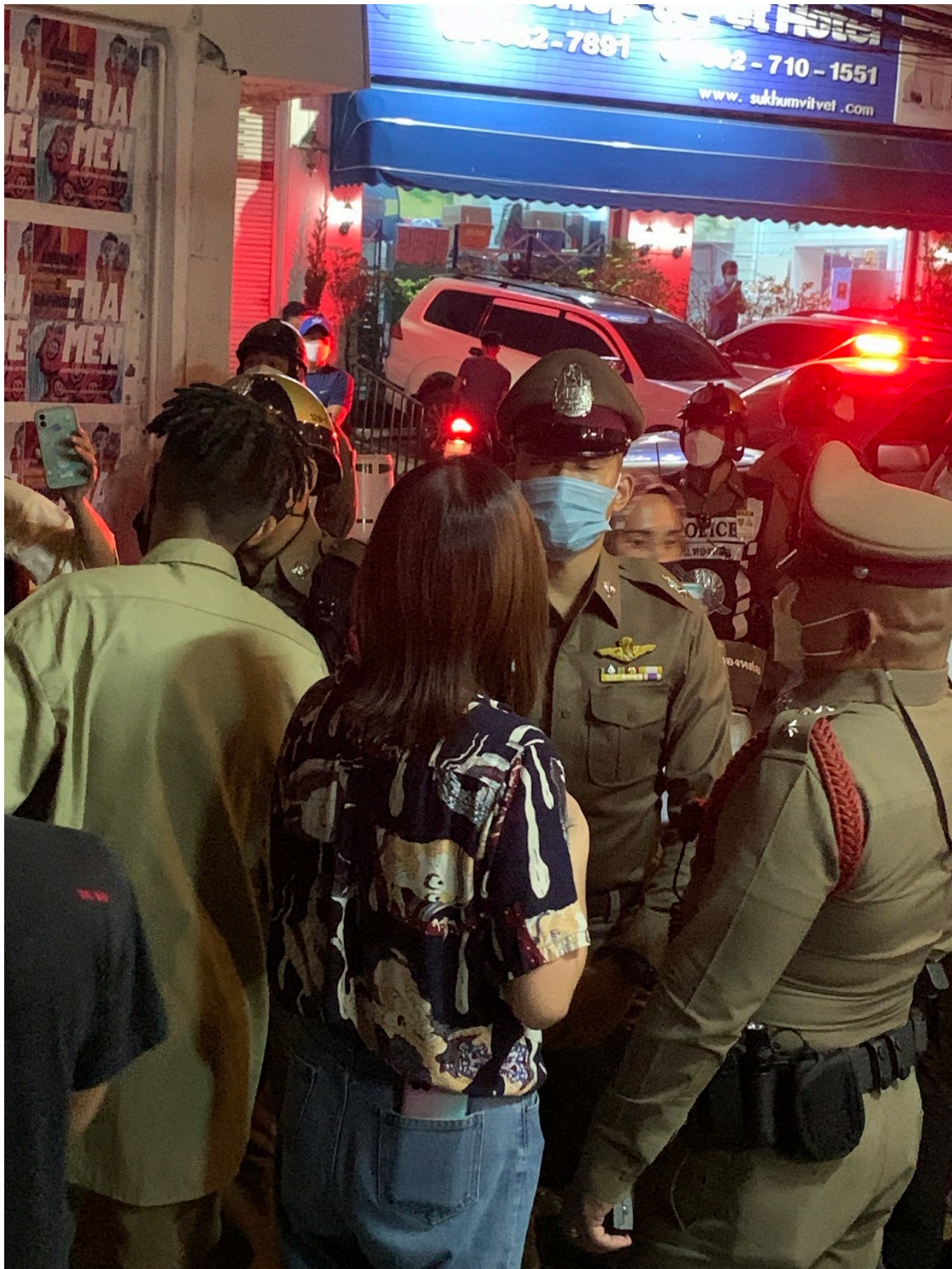
ตำรวจเข้าสังเกตการณ์ในกิจกรรมศิลปะที่ผนังกำแพงตึกฝั่งตรงข้าม WTF Gallery and Cafe เมื่อวันที่ 18 พฤศจิกายน 2564