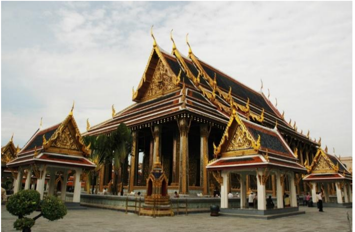
วัดพระศรีรัตนศาสดาราม กรุงเทพมหานคร

ศาสนา อันมีแก้ววิเศษทั้ง 7 ประการ อันได้แก่ จักรแก้ว ช้างแก้ว ม้าแก้ว รัตนะ (มณีโชติ) โดยใช้พระแก้วมรกต เป็นสัญลักษณ์เพื่อแสดงถึงความชอบธรรมในการมีอำนาจเหนือดินแดนนั้นๆ ในพระราชนิพนธ์ของพระบาทสมเด็จพระจอมเกล้าเจ้าอยู่หัวก็ได้กล่าวว่า พระแก้วมรกตนั้นมีอำนาจบารมีทำให้สยามในยุคสมัยรัตนโกสินทร์ต้องรอดพ้นจากอริราชศัตรูจากอาณาจักรใกล้เคียงและวิกฤตทางการเมืองหลายครั้ง