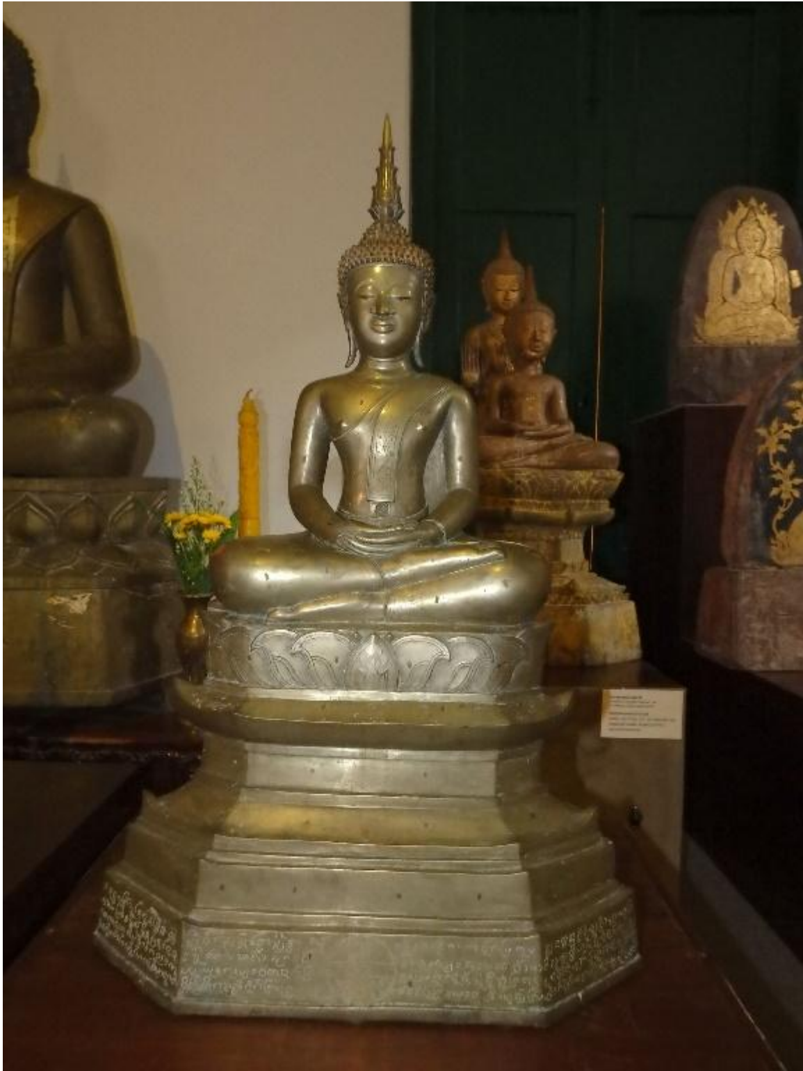
พระแก้วมรกตจำลอง (เทียมพระแก้วมรกตเจ้า)

ล้านช้างเวียงจันทน์ได้สูญเสียความเป็นจักรพรรดิราชเหนือฝั่งซ้ายและฝั่งขวาของดินแดนแถบแม่น้ำโขง ซี มูล นับตั้งแต่สมัยกรุงธนบุรีจนถึงรัตนโกสินทร์ตอนต้น สยามใช้โอกาสที่เจ้านายล้านช้าง (ลาว) เกิดความขัดแย้งกันจนนำไปสู่การแทรกแซงทางการเมือง เจ้านองศ์เองมีความพยายามที่จะฟื้นฟูสถานะความเป็นจักรพรรดิราชขึ้นมาจึงได้สร้างหอพระแก้วและพระปฏิมาจำลองจากพระแก้วมรกตพระองค์จริงที่ปัจจุบันตั้งอยู่ในพระบรมหาราชวังกรุงเทพมหานคร ต่อมาเจ้านองศ์พ่ายแพ้จากการที่พระองค์ต้องการฟื้นฟูอำนาจของราชสำนักล้านช้างเหนือลุ่มแม่น้ำโขง