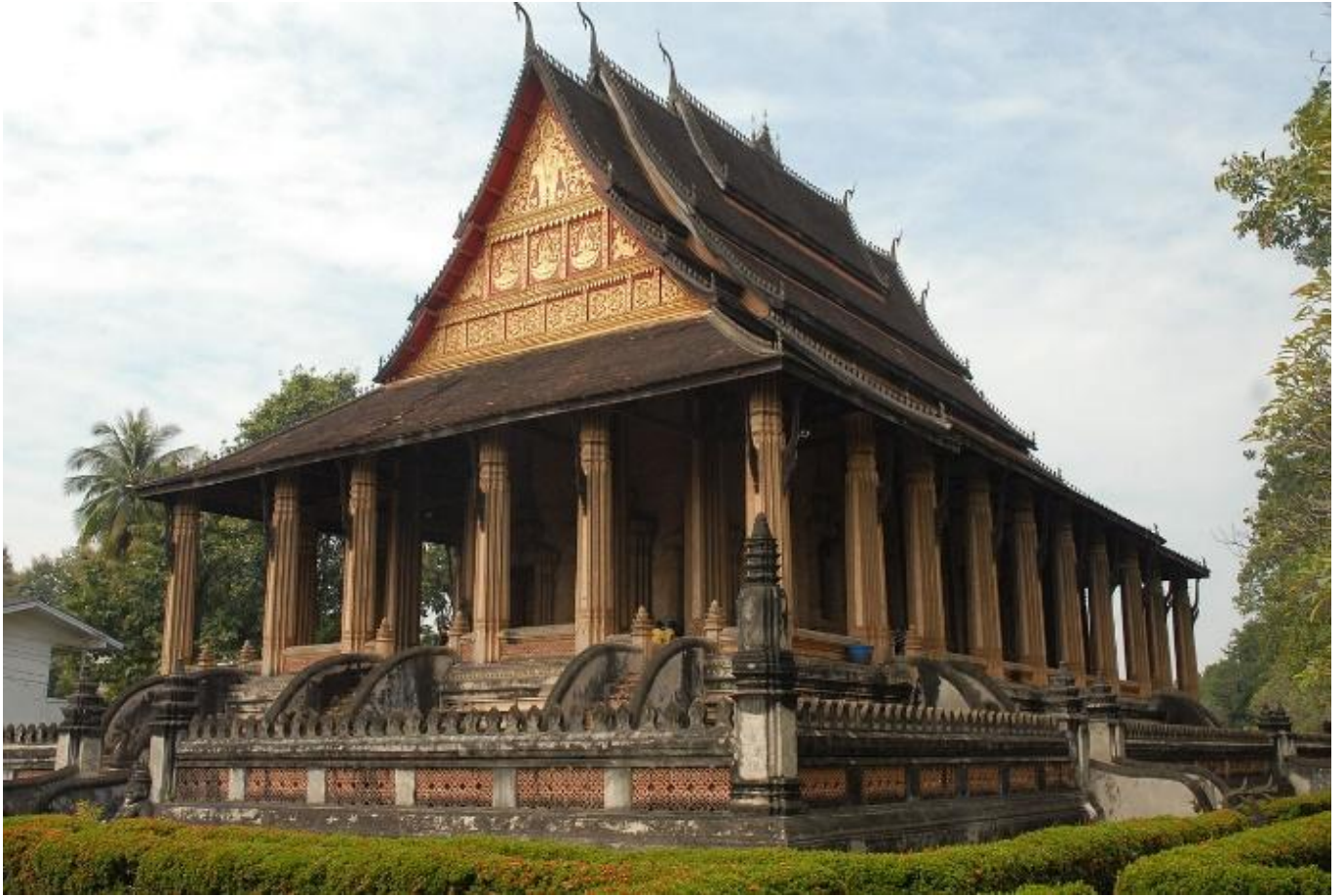
หอพระแก้ว กรุงเวียงจันทน์

หลักฐานทางประวัติศาสตร์ชี้ให้เห็นถึงความสัมพันธ์เชิงอำนาจในยุคจารีตระหว่างสยามและล้านช้างเวียงจันทน์ได้เป็นอย่างดี ในเวลานั้นเจ้าอนุวงศ์เองไม่ได้เพียงเคารพและศรัทธาพระแก้วมรกตในฐานะพระพุทธรูปศักดิ์สิทธิ์คู่กรุงศรีสัตนาคณหุต (เวียงจันทน์) แต่เดิมเคยประดิษฐานอยู่ที่หอพระแก้ว แต่ยังปรารถนาที่จะรื้อฟื้นความเป็นพระจักรพรรดิราชของตนด้วย จารึกอักษรธรรมล้านช้างใต้ฐานพระพุทธรูปเป็นหลักฐานชั้นต้นอย่างดี มีการถอดความได้ดังนี้